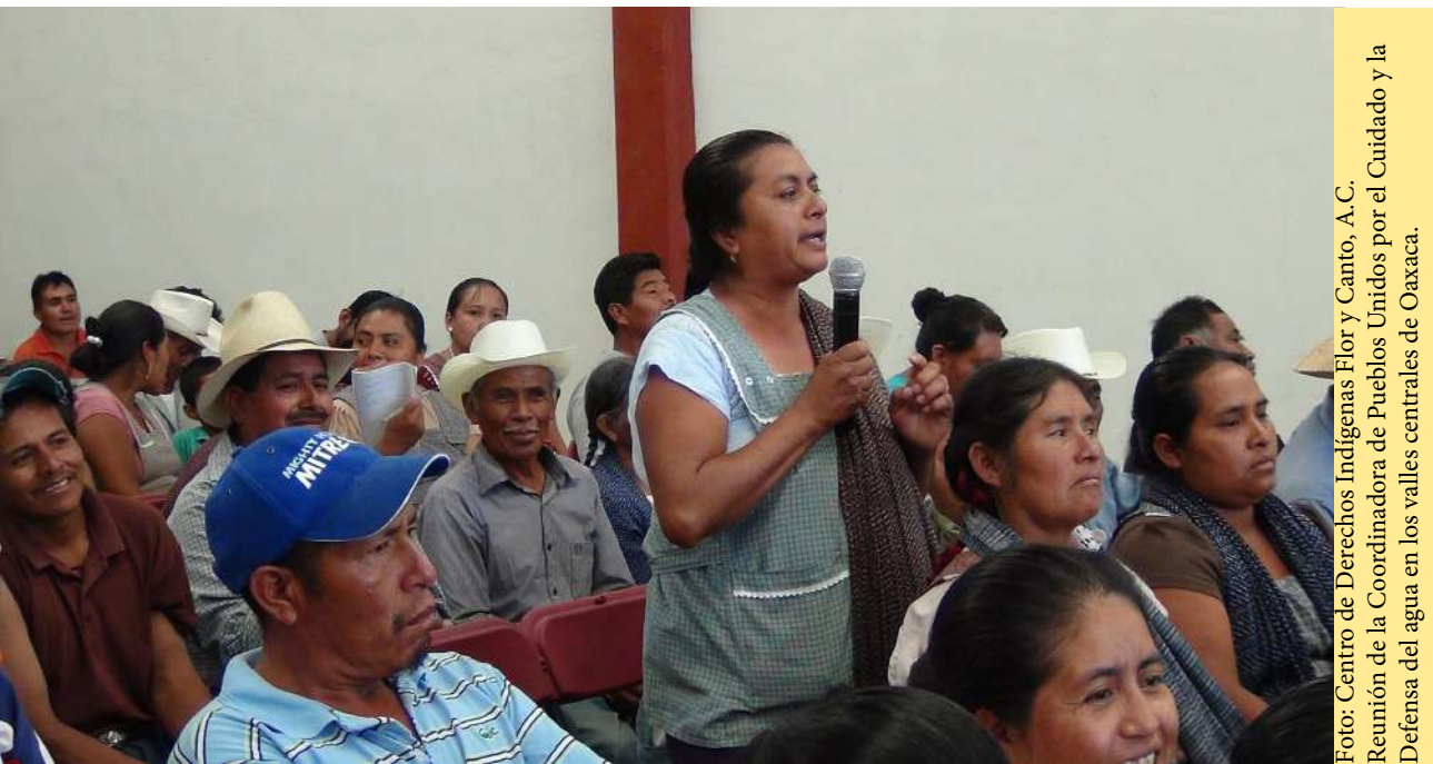
Reunión de la Coordinadora de Pueblos Unidos por el Cuidado y la Defensa del agua en los valles centrales de Oaxaca.