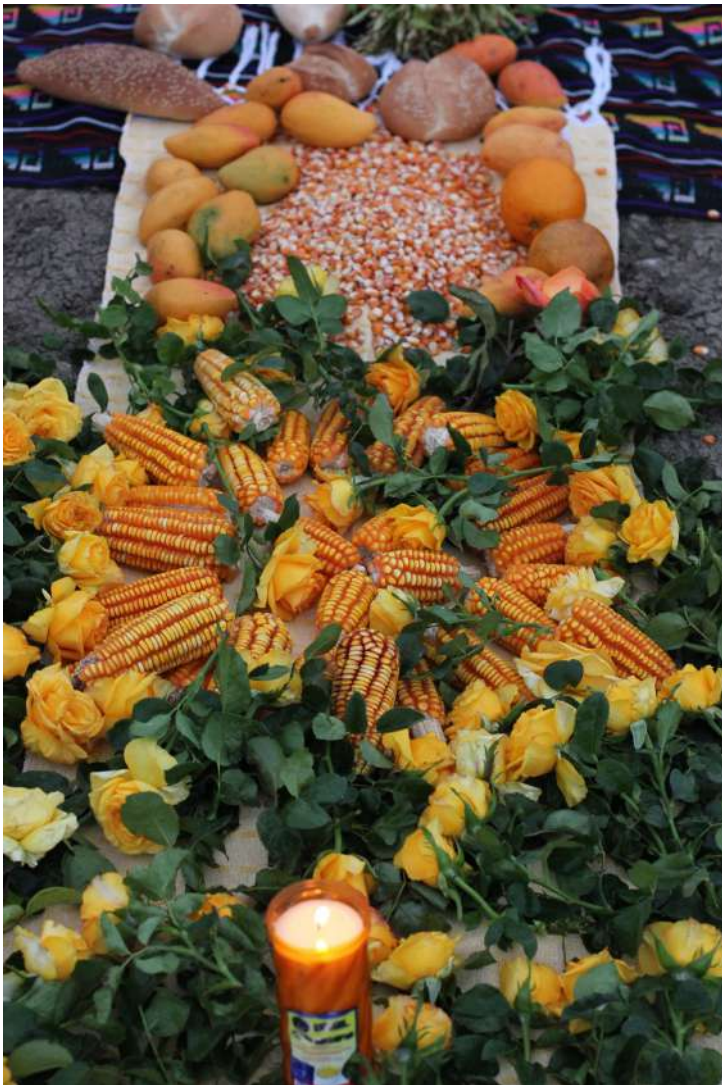
Foto: Flor y Canto Ceremonia Ritual del pueblo zapoteco para el agua.