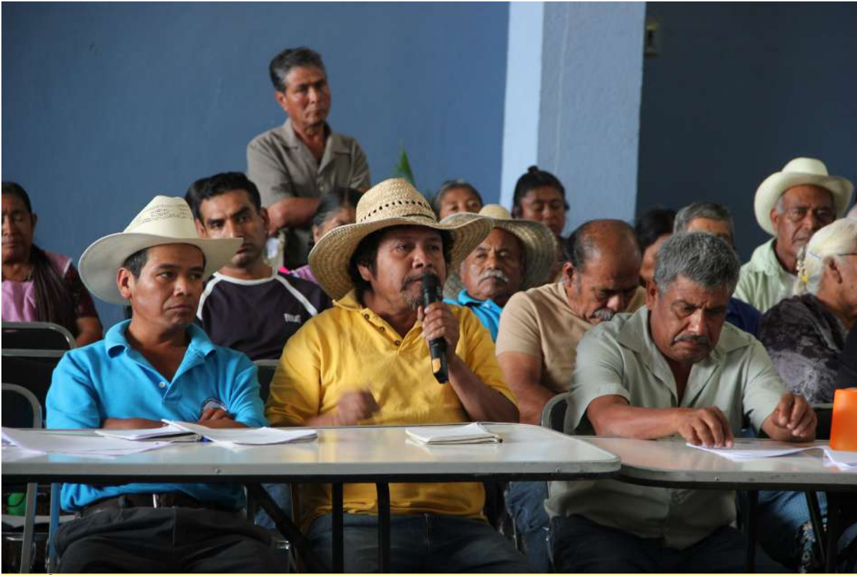
Foto: Flor y Canto Reunión de la Coordinadora de los Pueblos Unidos por el Cuidado y la Defensa del Agua