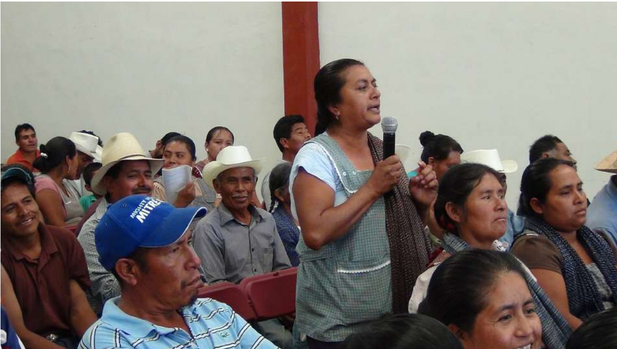
Reunión de la Coordinadora de los Pueblos Unidos por el Cuidado y la Defensa del Agua