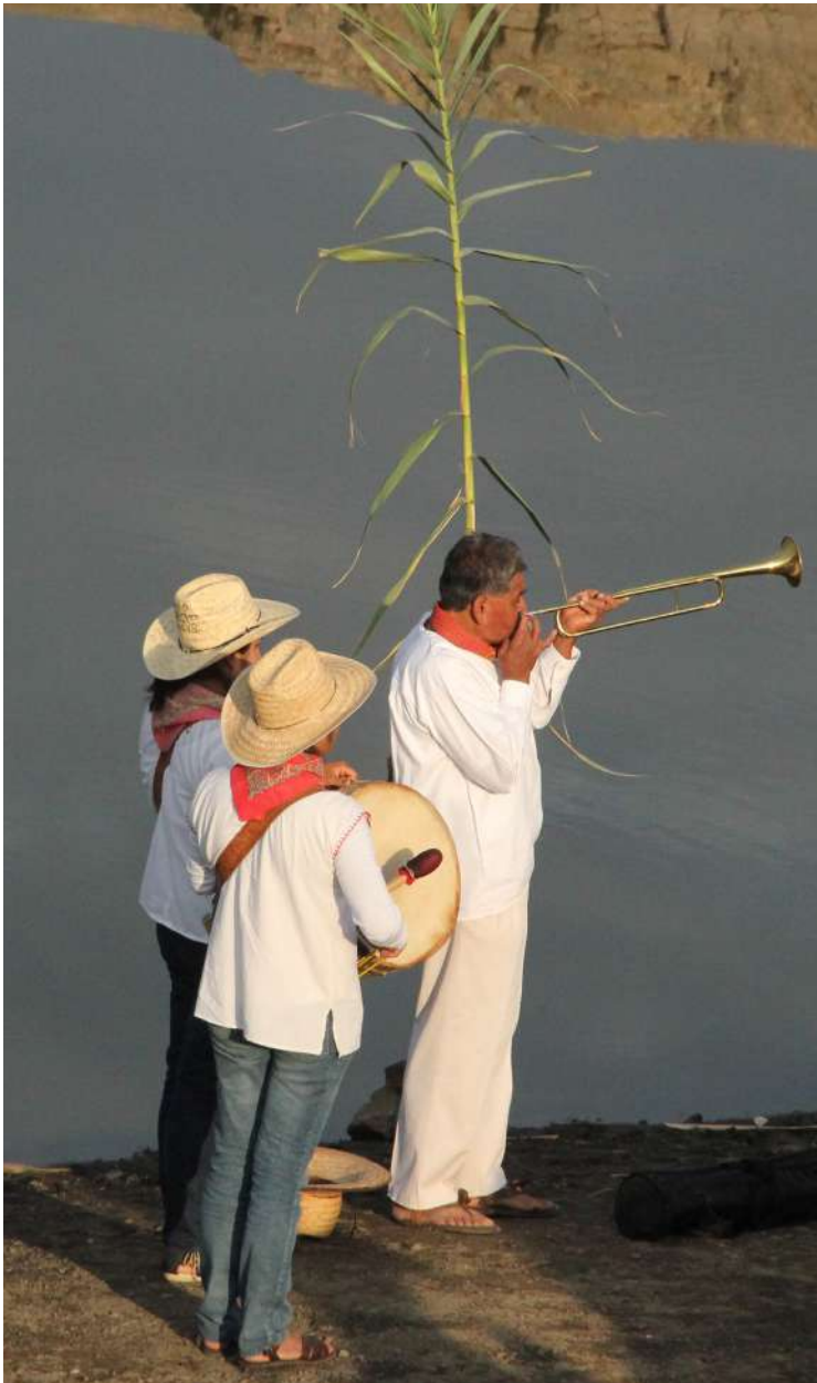
Ceremonia ritual al agua.

El agua dulce es un bien común fundamental para la vida. Debido a su importancia la responsabilidad de su cuidado recae sobre la humanidad en su conjunto; no obstante, en estos últimos años estamos viviendo una situación alarmante a escala mundial, pues se le despilfarra y contamina sin escrúpulos. En este contexto el agua fluye hacia el poder generando una profunda desigualdad, pues no todas las personas tenemos acceso a este bien, violándose nuestro derecho humano al agua.